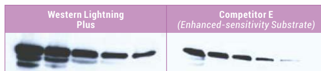
Western blots, serial dilutions of peanut lectin, rabbit anti-peanut lectin antibody, goat anti-rabbit HRP, 1-minute exposures.

Western Lightning® Plus 具有比一般 ECL 更高的靈敏度